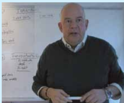
DIN NYA LÖN Förhandlingsansvarige informerar