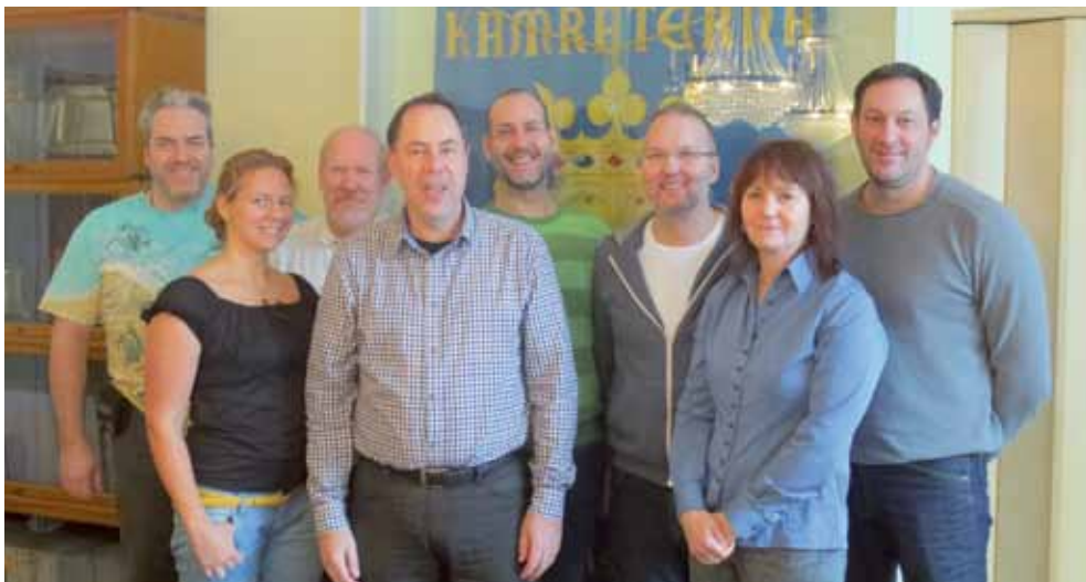
Länspolisföreningens styrelse i samband med konstituerande styrelsemöte

Vi utvecklar vår egen fackliga organisation. Teknikerna har bildat facklig sektion och vi hoppas att de snart får följa av en facklig sektion på den nya bedrägeriroteln.