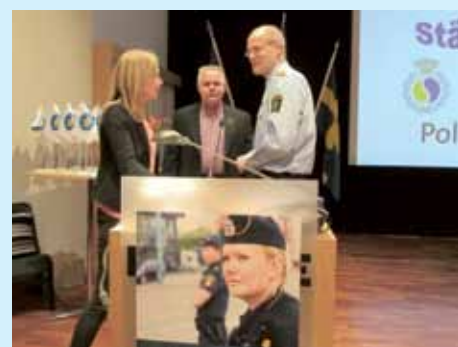
STÄMMAN Historia och framtid