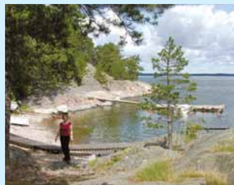
Lilla Valön Något att njuta av?