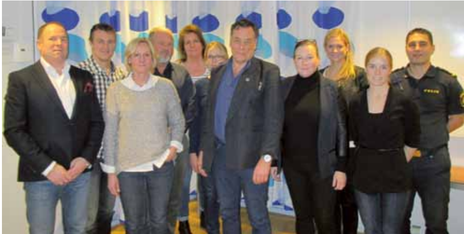
SÖPOs "nya" styrelse