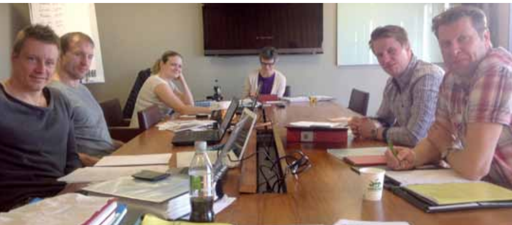
Birka styrelse i sammanträde

Tittar ut och tänker att förra veckan var det vår och nu ser det ut som det är jultid ute, men tiden går fort och snart är sommaren här. Det har varit en lång vinter med mycket att göra rent fackligt.