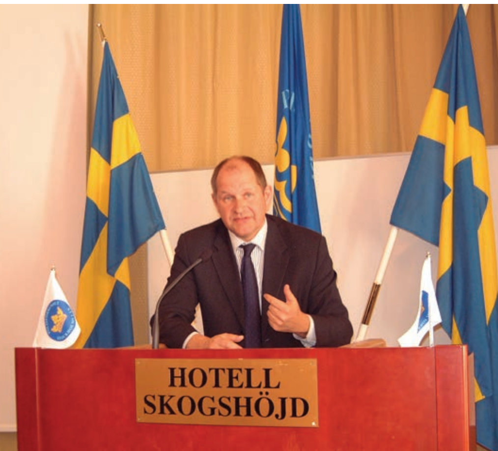
Dan Eliasson på stämman i förbundsområde Stockholm 2005

Dan Eliasson är en gammal bekant för en del av oss polisackliga i Stockholmsregionen. Vid stämman år 2005 var Dan statssekreterare på Justitiedepartementet under Thomas Bodström och höll ett starkt och mycket applåderat tal inför de församlade. Det var flera av oss som var där som funderade vad som skulle bli av talaren. Nu vet vi, han blev Rikspolischef!