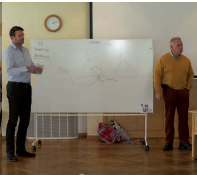
Bilder från föreningsrådet

Nu är vi inne i december 2014 och det dröjer inte länge tills vi går in i omorganisationen på allvar!!!