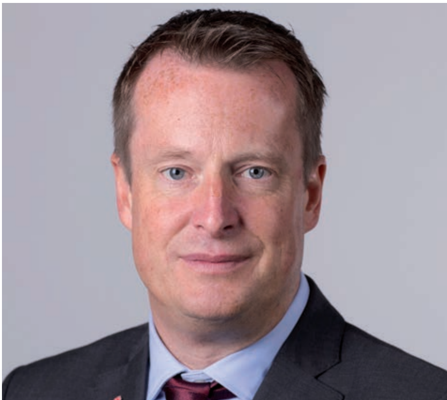
Inrikesminister Anders Ygeman

Anders Ygeman vill till skillnad från sin föregångare inte sätta någon exakt siffra på hur många poliser det bör finnas. -Fler poliser är viktigt, säger Ygeman, men det är inte det enda som spelar roll för att öka tryggheten och öka brottsuppleringen. Vi vet att upplärningsprocenten paradoxalt nog har minskat, trots att antalet poliser har ökat under samma period. Orsakerna är förstas många till att upplärningsprocenten har minskat; bedrägeribrotten har ökat, IT-brottligheten blir allt mer omfattande etc. men klart är att antalet poliser inte står i direkt relation till hur många brott som klaras upp. Jag tror att den nya polisorganisationen kan bidra till att minska det administrativa arbetet, och att fler poliser kommer att kunna tjänstgöra nära medborgarna. Det, tror jag, är avgörande för att polisen ska kunna göra ett bra jobb, säger Ygeman.