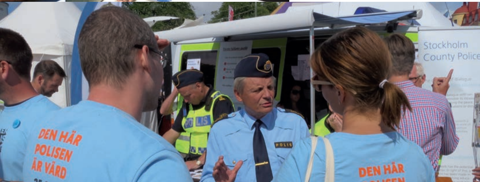
Engagerad Rikspolischef i samtal med lika engagerade Polisförbundare i Almedalen

Från den 1 januari 2015 lär han få förmånen att patrullera i civila kläder, i Söderköping