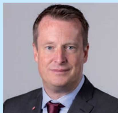
ANDERS YGEMAN Inrikesminister med ansvar för Polisen