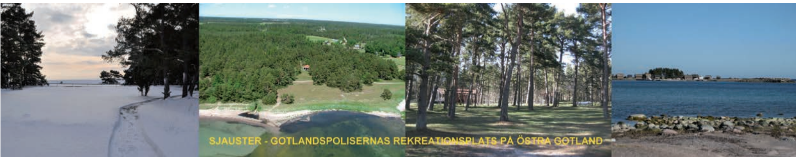
SJAUSTER - GOTLANDSPOLISERNAS REKREATIONSPLATS PÅ ÖSTRA GOTLAND

SJAUSTER PÅ ÖSTRA GOTLAND Välkommen att boka boende/campingplats på Förbundsområde Gotlands rekreatiions-anläggning Sjauster.