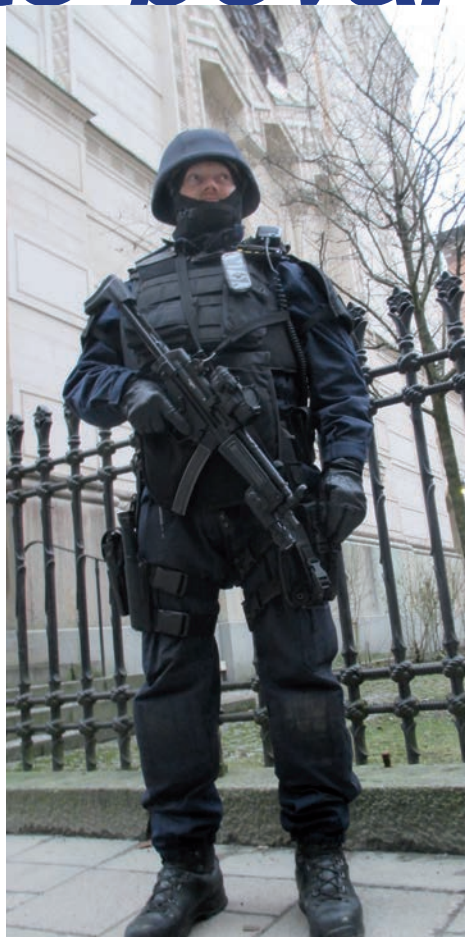
Utrustad polis till allmänhetens och sitt eget skydd