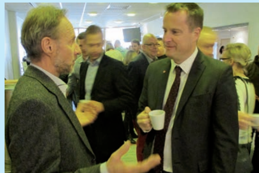
STÄMMA I REGIONEN Med prominenta talare