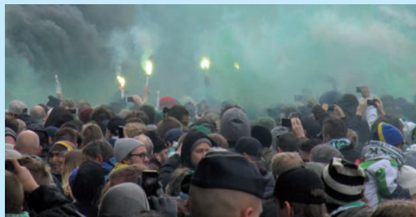
ARBETSMILJÖ För poliser