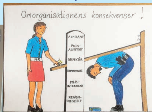
REKRYTERING Då och nu