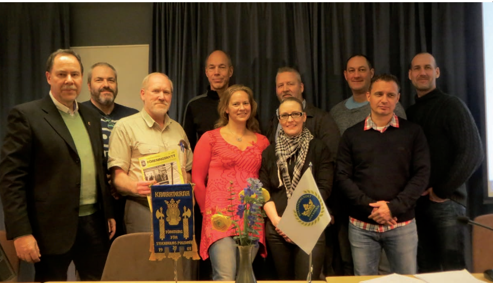
Den nyvalda styrelsen för Kamraterna