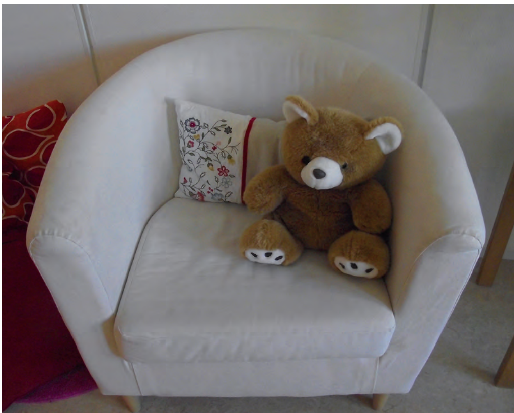
Miljö på barnahus

Det är viktigt att barnutredaren tar reda på så mycket som möjligt om barnet, och alla omständigheter runt omkring, för att kunna hålla förhöret på ett så professionellt och bra sätt som möjligt. Under förhöret ska (helst) inga handlingar finnas i förhörssituationen, det är fokus på barnet och att lyssna som gäller. Inga ledande frågor ska ställas och det får inte bli så att Tingsrätten inte kan göra en korrekt bedömning av barnets berättelse.