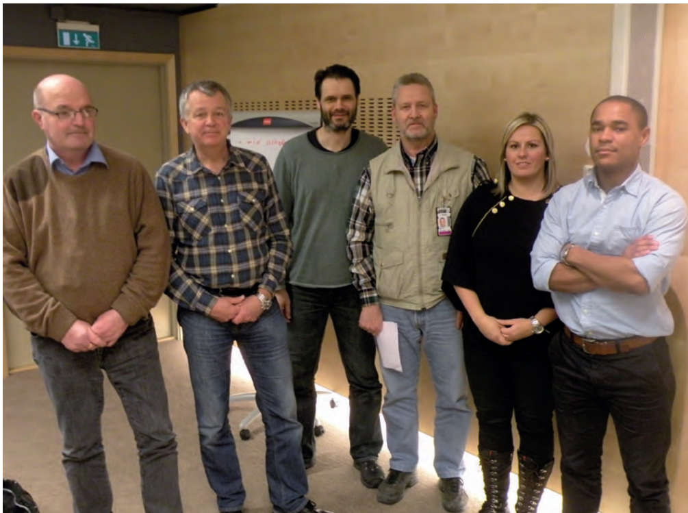
Lejonparten av GPF styrelse