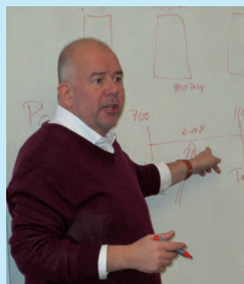
RALS 2012-13 Ramarna som ger din lön