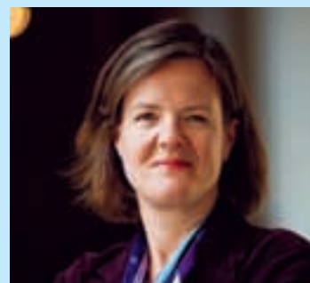
KRÖNIKAN Av Carin Jämtin