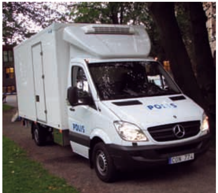
Myndighetens nya kylbil.