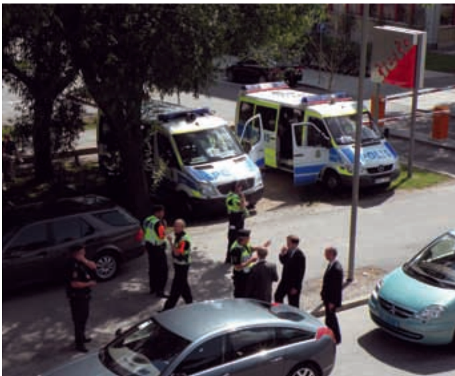
Det planerade upplägget iscensätts och säkerheten diskuteras med andra grupper med ansvar för säkerheten. Bilden är tagen vid RIF-mötet (Rätts- och migrationsfrågor) i Älvsjö.