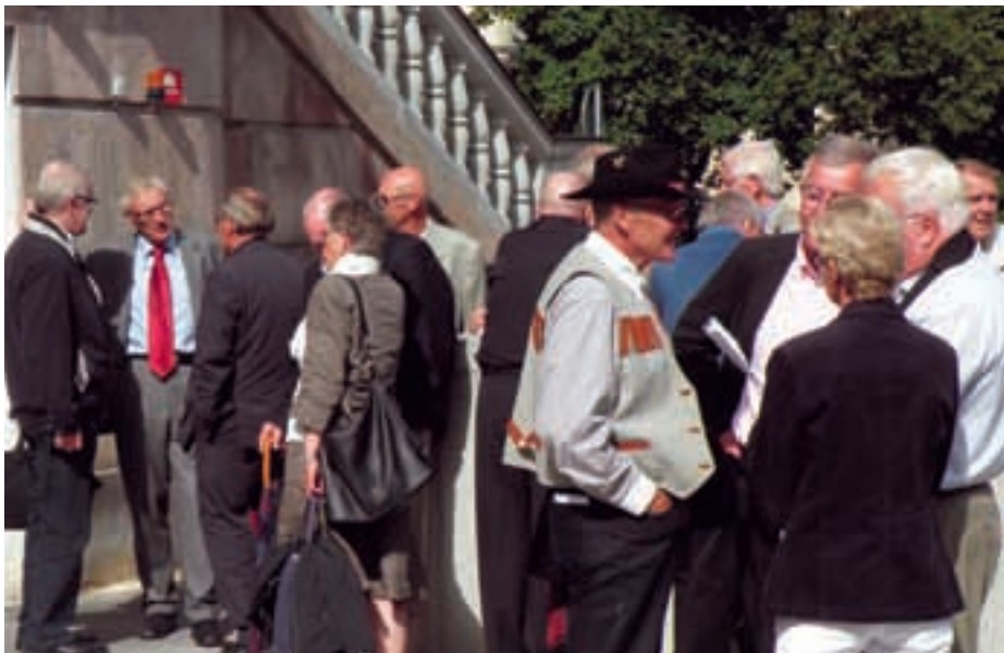
Mycket att prata om och att minnas då gamla kollegor träffas igen efter många år.

Efter henne talade säpochefen Anders Danielsson om framtiden och om vad det kan komma att innebära för polisen.