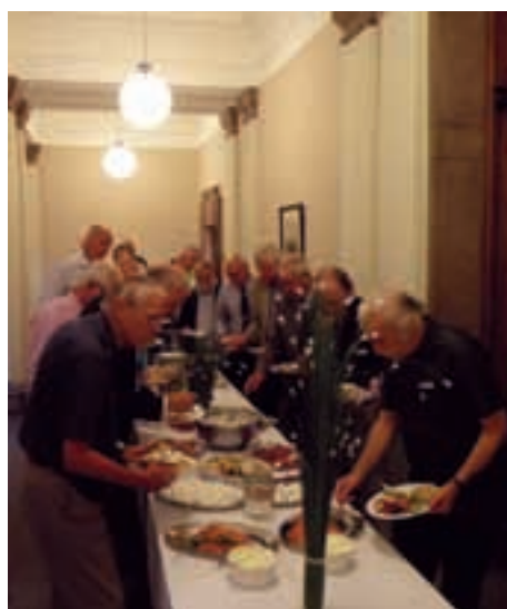
Dagen avslutades med middag som intogs i entréhallen i gamla polishuset på Kungsholmen.

Någon minns och berättade om den Kungsholmspolis som var något av ett fysiskt fenomen. Han sprang och åkte skidor så fort han kom åt. Han simmade från Södermälärstrand till Norrmälärstrand och sprang till stationen. Efter jobbet simmade han hem igen.