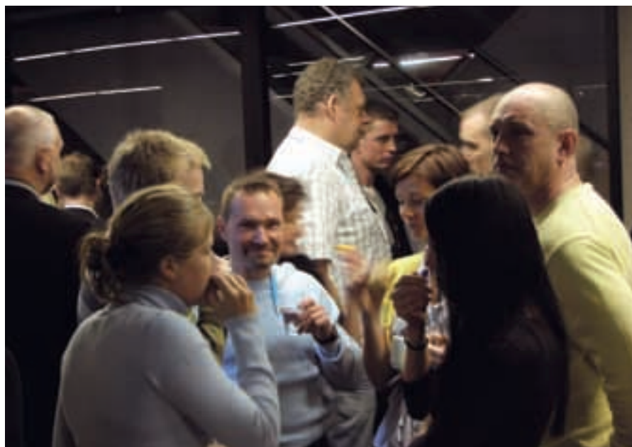
Gamla och nya ansikten i vimlet av stämmodeltagare under en av pauserna.