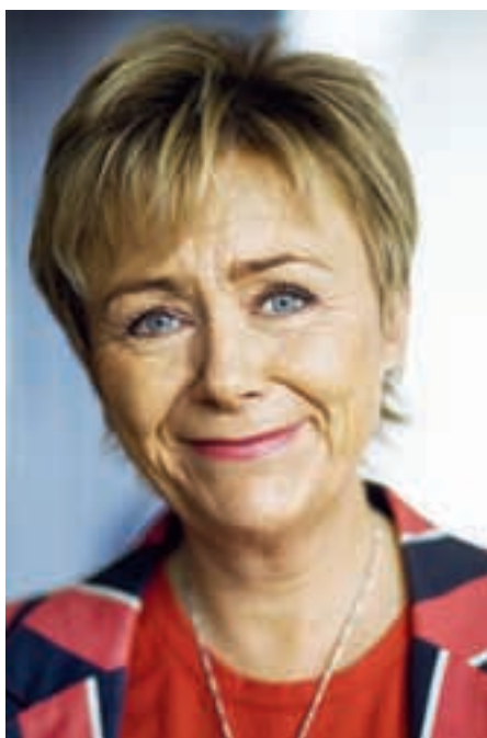
Justitieminister Beatrice Ask

Jag är inte så naiv att jag tar en enstaka nedgång till intäkt för att polisen, eller att vi från regeringens sida, nu gör allting rätt och att den ständigt stigande våldspiralen en gång för alla är bruten. Vi har fortfarande ett stort arbete och många utmaningar framför oss, inte minst när det gäller ungdomsvåldet. Men som polis verksam i Stockholm borde bara det faktum att insatser ger resultat och att våldet faktiskt kan minska vara inspirerande och anledning att sträcka på sig lite grann.