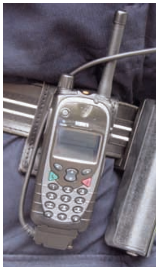
Handradiostation till RAKEL-systemet

...när det ser ut som det gör? (Eller vem är det som gör det för vem?)