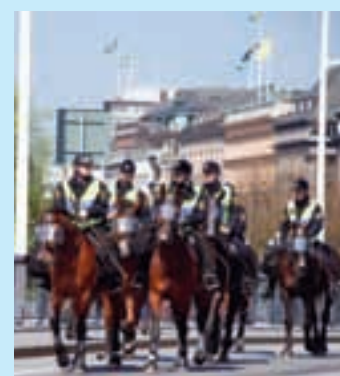
STORA POLISINSATSER - En vardag !