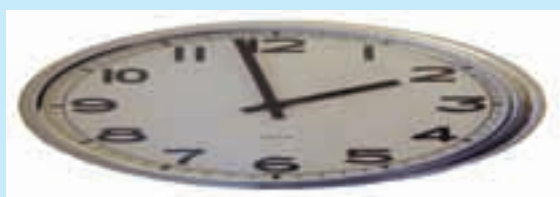
NYA ARBETSTIDSAVTALET Hur påverkar det dig?