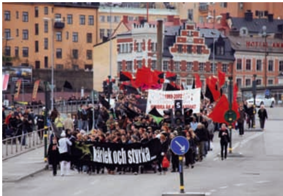
AFA:s demonstrationståg vid Slussen den 1 maj.

Poliskommenderingarna den 1 maj kring de tillståndsgivna demonstrationerna under dagen, samt de befarade oroligheterna kring befarade oroligheter under beteckningen Reclaim senare under kvällen gick bra. Svensk Handel har gett polisen beröm för att det inte skedde någon