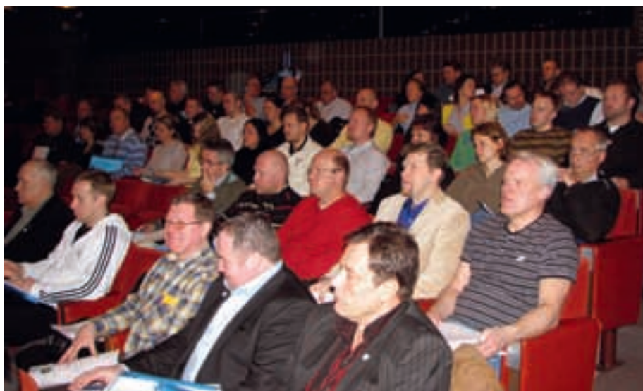
På stämman deltog, förutom de 90 ombuden, ca 20 inbjudna gäster.