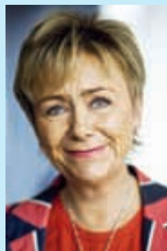
KRÖNIKAN Av Beareice Ask