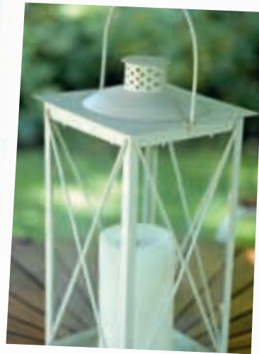
Nordea Bank AB (publ)