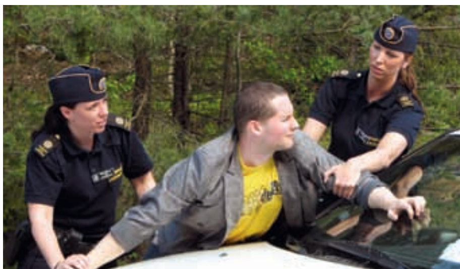
Tre elever vid polisutbildningen i Sörentorp under en övning i inbripande mot berusad person.

FOTNOT: Vill du gå till källorna och läsa mer? Enklast gör du det på www.blaljus.nu . Där kan du till exempel hitta hela utredningen om polisutbildningen. Du kan testa dig själv i det nya språkprovet m m. Det här är länkarna: