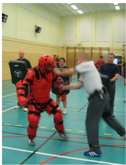
Examensprov i användandet av expanderbar batong

Beredskapspolisen är modernt utrustad och med utgångspunkt från de uppgifter enheten kan förväntas användas till. En beredskapspolis bär polisuniform med ett särskilt bröstblem "Beredskapspolis". Utrustningen är annars i stort sett densamma som för yrkespoliser. Avseende bevapning utbildas beredskapspolisen på polisens ordinarie tjänstepistol Sig Sauer samt OC-spray. När beredskapspolisen tjänstgjorde efter stormen Gudrun var endast gruppcheferna bevapnade.