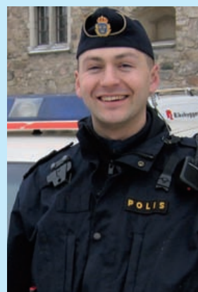
KRÖNIKAN av Rafael Kiertsz