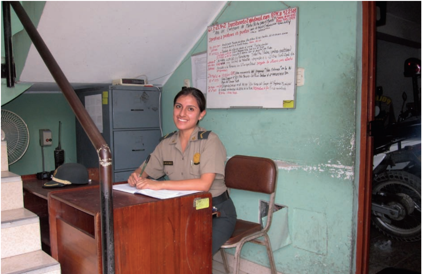
Avskildhet? Ergonomi? Luftigt med bra ljus och lämplig luftbehandling? Ljudmiljön? Permanent arbetsplats? Fikaautomat? Bilden föreställer en arbetsplats hos trafikpolisen i Lima, Peru.

Lokalproblem är en av de återkommande frågor som tas upp på länets skyddsombudsmöten.