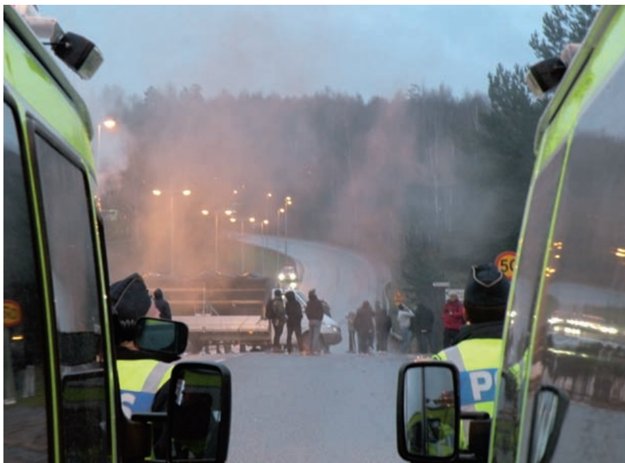
Tillbud till yrkesskada - men vad händer sedan?

Myndigheten har använt sig av det webbaserade arbetsskade- och tillbudssystemet LISA sedan våren 2008. Inte sällan måste nya system utvecklas och omarbetas under resans gång och LISA har på intet sätt varit något undantag. I många sammanhang måste vi inom Polisen anpassa verksamheten efter systemen och inte tvärtom, vilket borde vara det mer korrekta och den mest smidiga lösningen. Vi har samverkat och samarbetat med arbetsgivaren i olika grupper och i olika sammanhang beträffande hanteringen av arbetsskador och tillbud och det har vidtagits en rad åtgärder i frågan. Arbetsgivaren har nu tagit initiativ till en samverkansgrupp för att finna lösningar inom det här området som vi inom kort hoppas kunna redovisa. Tyvärr är det så att vi fortfarande har problem när det gäller hanteringen av arbetsskador och tillbud och problembilden i den här frågan är tudelad.