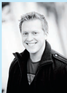
DEBATT av Magnus Bergle