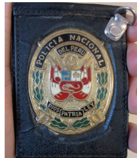
Bild till höger Såhär ser polislegitimationen i Peru ut. Den fick Jon av Lutcho som gåva och när Jon frågade om det inte skulle innebära problem för honom sa han att han hade flera, de är inte nummerade!