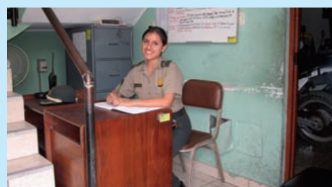
En polislokal, i Peru