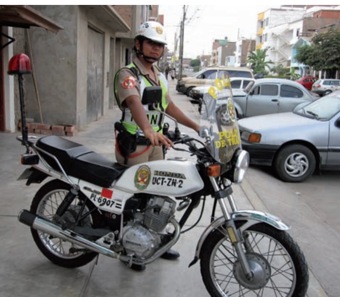
Bild till vänster Trafikpolisen redo för kvällspasset. Notera den coola saftblanda-ren, och reflexvästen. Honda-motorcykeln är en CGL125:a, den ger 9 hästkrafter vid 8500 rpm och en topphastighet runt 115 km/t utan ruta...