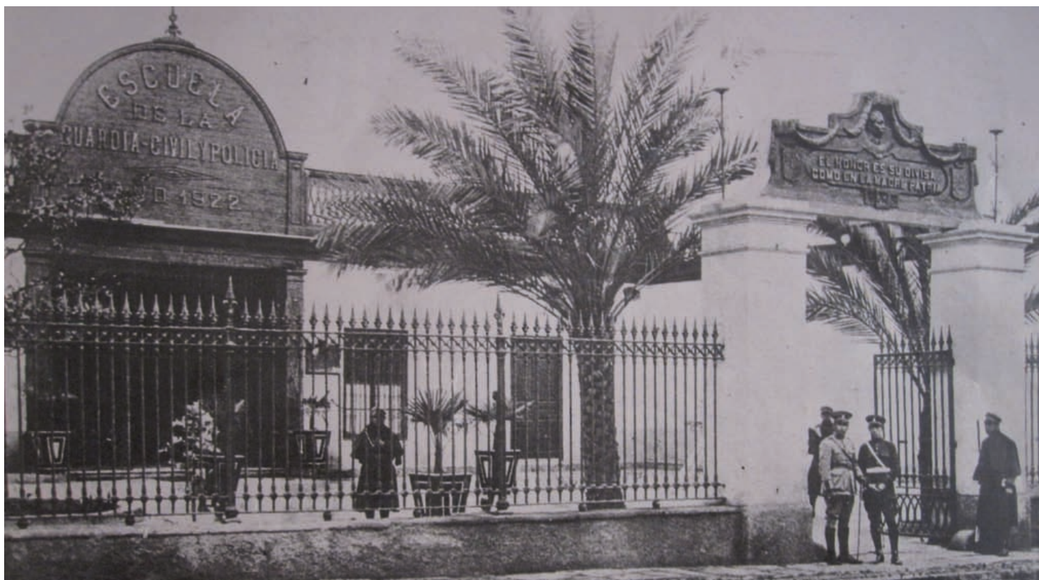
Polisskolan i Peru, Gammal bild som visar polisskolan i Lima, grundad 1922. Skolan finns kvar än i dag och tidigare var det ett mentalsjukhus.

"I slutet av 80-talet sköts min frus morbror ihjäl av en medlem ur en maoistisk terroristorganisation när han som polis vaktade en bank."