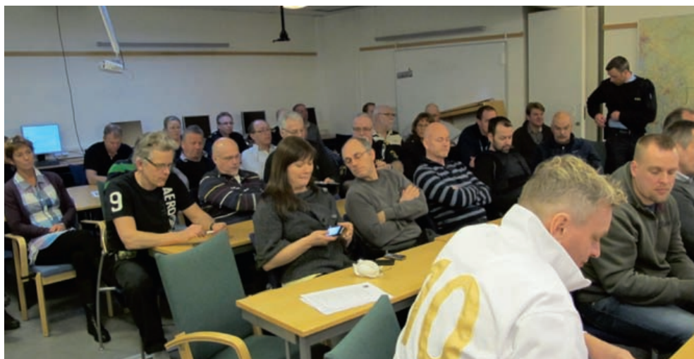
40 som inte var kommenderade i Roslagen

Tisdagen den 15 februari hölls årsmöte i Roslagen vilket denna gång var förlagt till Täby. Vi hade här lyckats pricka in en dag där distriktet hade ett sällsynt stort kommenderingsuttag samt lokal utbildningsinsats vilket medförde att antalet medlemmar på årsmötet stannade vid 40 personer.