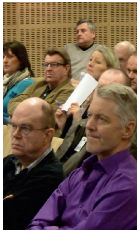
Spänd uppmärksamhet på årsmötet.