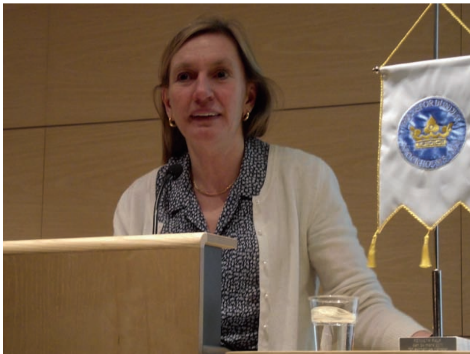
Länspolismästaren Carin Götblad höll uppmärksamheten på topp.

Länspolismästaren fick äran att ta hand om första delen av dödens timma, just efter den i hast intagna lunchen. När hon blev presenterad som Länspolismästarinna, tog hon genast upp tråden och sög på ordet... Länspolismästarinna... Det låter bra! Skulle man kanske trycka upp visitkort med den titeln?