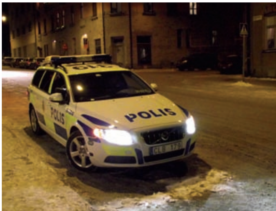
Polisbil eller taxi till andra myndigheter?

Stationsbefälet tog då ytterligare ett varv med socialtjänsten men det var helt omöjligt att få fram en ledig plats. Då stationsbefälet föreslog att man skulle köra ynglingen till socialjouren sa socialtjänsten uttryckligen nej till det. Enligt uppgift skulle det vara omöjligt på grund av interna konflikter sociala myndigheter emellan. När det tydliga beslutet kom hade man även varit i kontakt med socialnämndens ordförande.