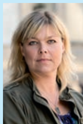
KRÖNIKAN, Av Anna Ramsten

GOTT NYTT ÅR önskar FÖRBUNDSOMRÅDES- STYRELSEN