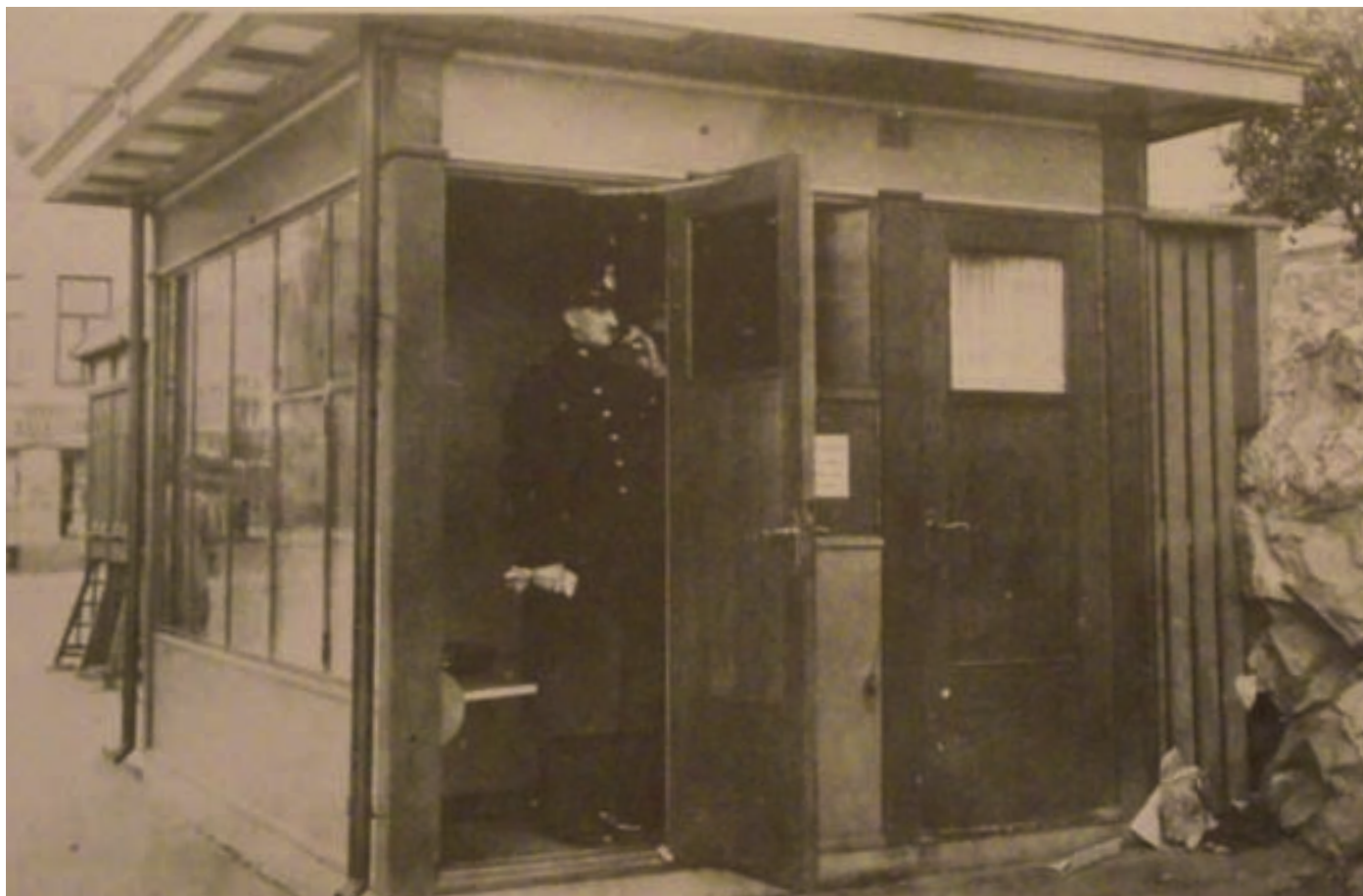
Poliskiosk i korsningen Skånegatan-Grindsgatan på Södermalm, tidigt 30-tal. Rapportering till station?