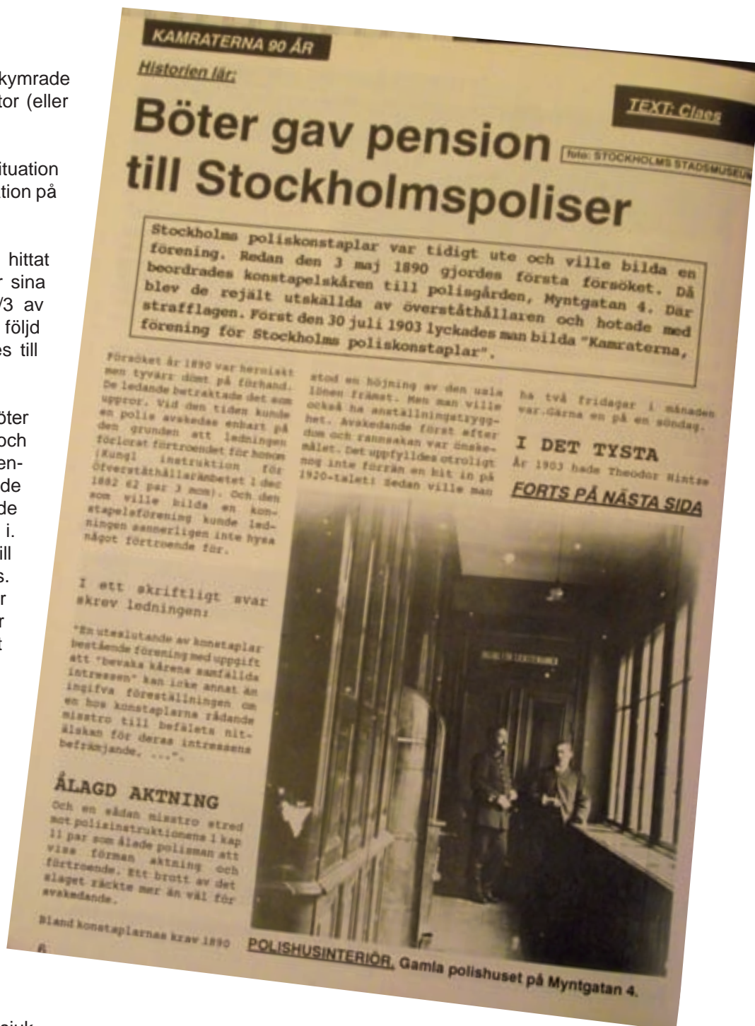
Interiörbild från Stockholmspolisens lokaler på Myntgatan 4 i Gamla stan. (1903)

Sedan dess har pensionssystemet reviderats åtskilliga gånger. För oss poliser senast 2008, då den kollektiva tjänstepensionen ökade med 4 %, vilket finansierades med såväl lönedel (2 % ur 2007-2010 års RALS), som minskade förmåner (bl a togs sjukvårdsersättning bort) och längre arbetstid (mellan 12 min för dagtidare och 1 – 3 timmar i veckan för skiftesarbetare).