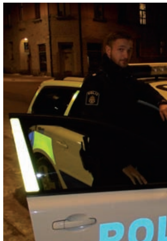
Poliser i nattskift - Vad kostar det?

De är problem och förutsättningar som våra medlemmar själva märkt