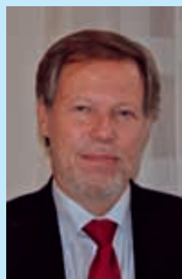
KRÖNIKAN, Av JO, Mats Melin