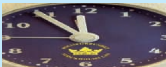
ARBETSTIDEN Ett utdraget arbetsmiljöproblem