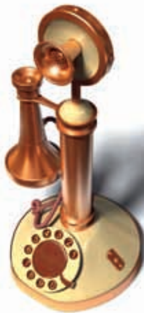
Hoppas nästa uppdatering fungerar

Uppgradering av handstationerna (Sepura version 10) kommer att införas i början på nästa år. Samtliga användare kommer att få genomgå en utbildning för att kunna arbeta med den nya versionen.