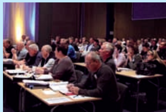
REPRESENTANTSKAP 2010 En sammanfattning för dig som inte var där.