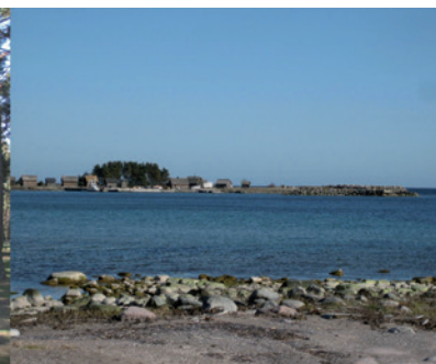
SJAUSTER - GOTLANDSPOLISERNAS REKREATIONSPLATS PÅ ÖSTRA GOTLAND

SJAUSTER PÅ ÖSTRA GOTLAND Stugan är fullbokad i sommar, men de flesta höstveckor/ helger är i skrivande stund lediga. En campingplats säsong 1/5-30/9 är ledig.