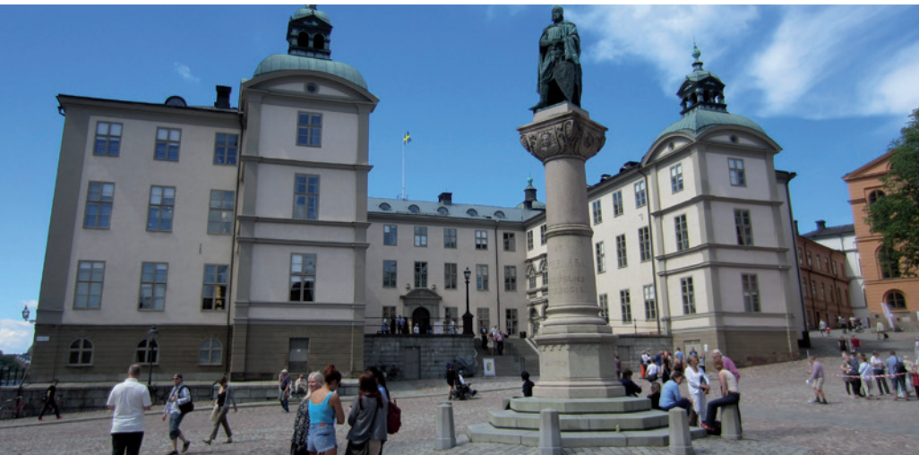
Svea Hovrätt, rättvisans högborg på Domstolens dag 8 juni 2014

Solna Tingsrätt gör skillnad på var poliser arbetar. På något annat sätt kan knappast domen B2185-15 tolkas. Tidigare har Brottsoffermyndigheten och olika domstolar haft bilden av poliser som en slags stålmän som tål ungefär vad som helst. Där har dock en förbättring av synen på människan i uniformen kunnat märkas, som vi uppfattat det.