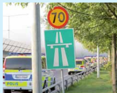
TRAFIKINSATS Polisarbete mitt i trafiken