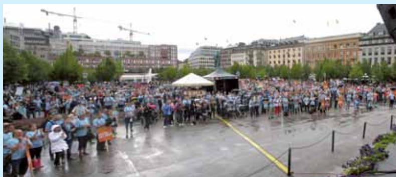
KUNGSAN 140824 Kamp ledde till glädje Hela Polisförbundet firade