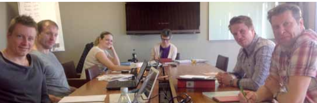
Birka styrelse i sammanträde

Ja, så är hösten här på allvar! Det har varit en intensiv sensommar – tidig höst. Först hade vi manifestationen i Kungsträdgården som var en upplevelse. De som var där från Västerort tyckte att det var mäktigt och alla stannade kvar trots regnet!