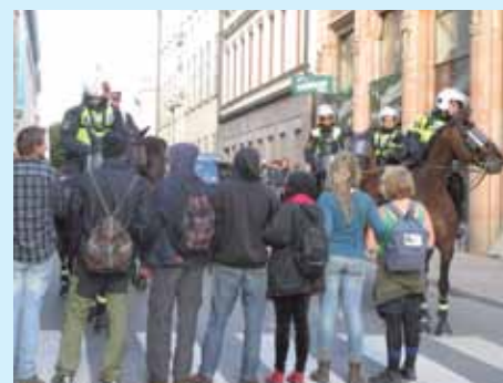
KUNGSAN 140830 Poliser och demonstranter