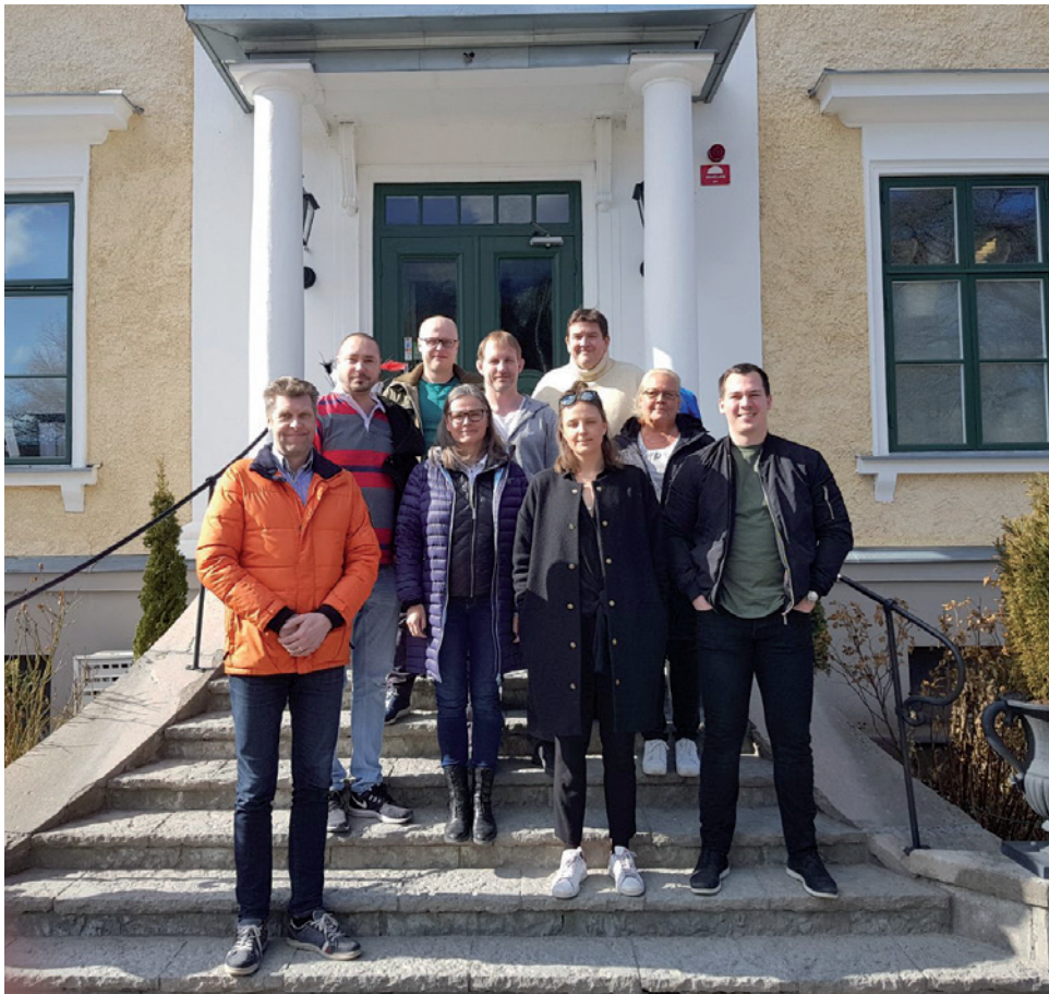
Styrelsen i förbundsområde Nord

I förbundsområde PO Nord är vi säkerligen inte de enda som noterat att sommarens varit ovanligt varm, för att inte säga extremt varm. Förutom en förmodad behaglig semestertillvaro har detta också påverkat den operativa verksamheten.