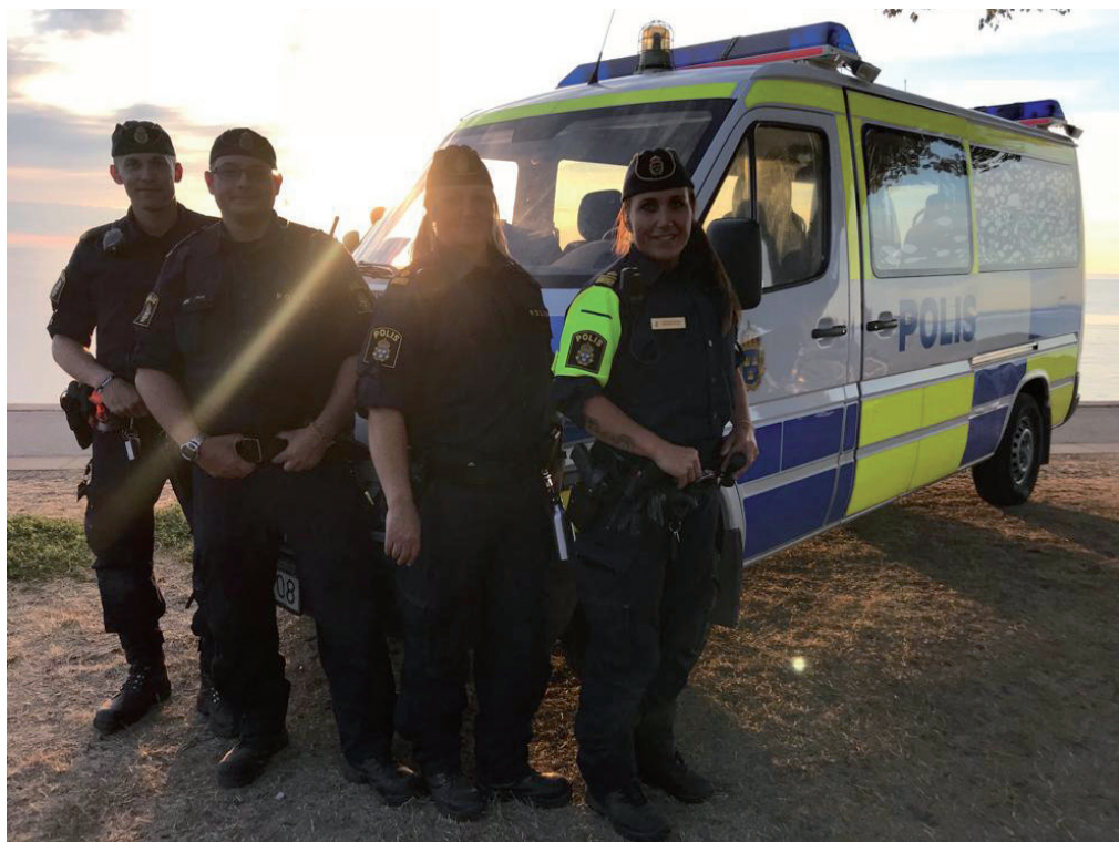
Strandpromenad i Visby

Veckan förflöt ganska snabbt då vi jobbade varje dag förutom på vår fredag sista dagen. Det största samtalsämnet och störningsmomentet var NMR:s närvaro under Almedalsveckan.