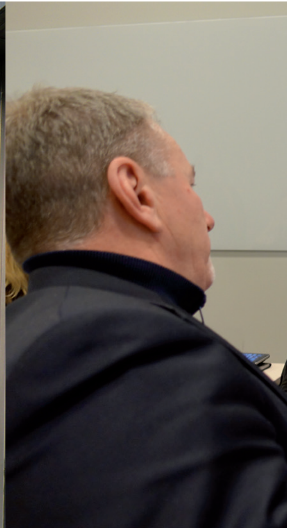
Arbetstider och löner engagerar och påverkar Förbundsregion Stockholms ansvariga för dessa frågor

Enligt EFTA-domstolen ska således restid räknas som arbetstid när arbetstagaren beordras till arbete utanför ordinarie tjänstgöringsställe. Detta under förutsättning att resan är nödvändig för att arbetet ska kunna utföras.