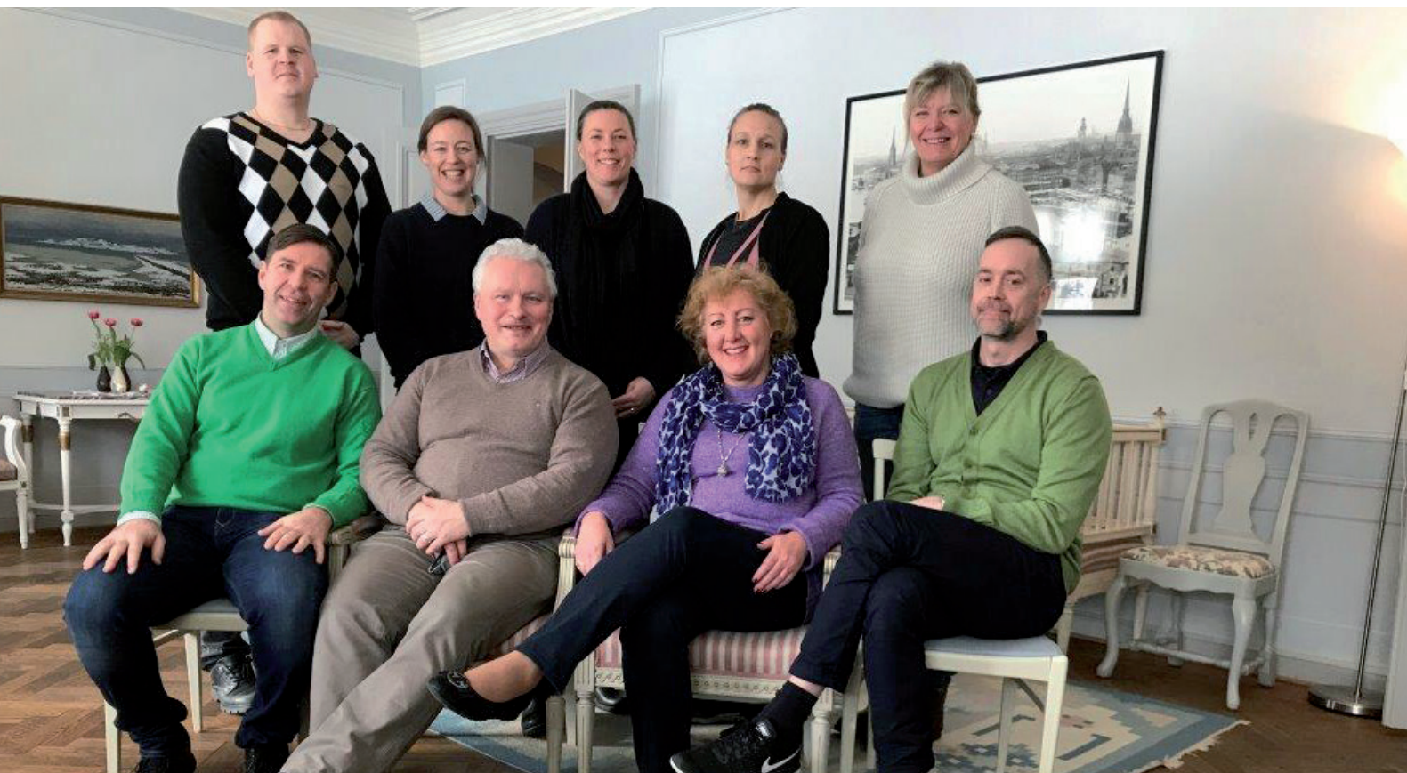
Birger Jarls styrelse

Så lider ytterligare en sommar mot sitt slut. Den varmaste i mannaminne med borttorkade skördar och skogsbränder. Tankarna gick någon gång till de av er som var ute och jobbade i den värsta värmen. Även om det numer finns AC i radiobilarna brukar det inte bli så mycket bilåkande under den värsta semesterperioden och känslan av fastklibbad skyddsväst kom över mig.