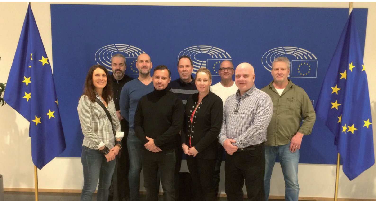
Kamraternas styrelse på EU-besök

Sommaren lider mot sitt slut och personalen återvänder till sina arbetsplatser.